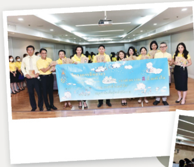
กิจกรรมที่ 2