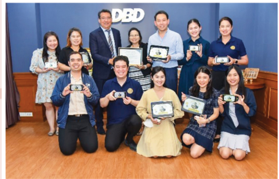
การมอบรางวัล “DBD Ethical Excellence Award : รางวัลความเป็นเลิศทางคุณธรรม” วันที่ 21 กรกฎาคม 2566 ณ กรมพัฒนาธุรกิจการค้า