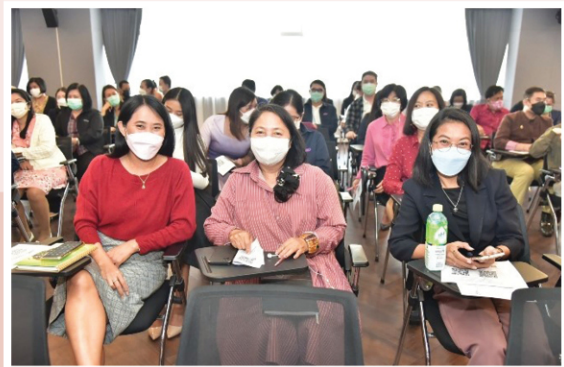
โครงการอบรมให้ความรู้ด้านการป้องกันและต่อต้านการทุจริต และส่งเสริมคุณธรรมจริยธรรม ให้แก่ข้าราชการและเจ้าหน้าที่ในหัวข้อ “รู้ทัน ป้องกัน การทุจริตทุกรูปแบบ” วันที่ 31 มกราคม 2566 เวลา 13.00 – 16.30 น. ณ ศูนย์ประชุม 1 ศตวรรษ ชั้น 6 กรมพัฒนาธุรกิจการค้า