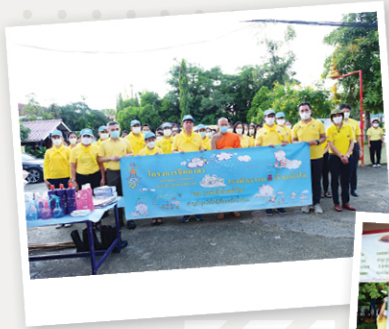
กิจกรรมที่ 1